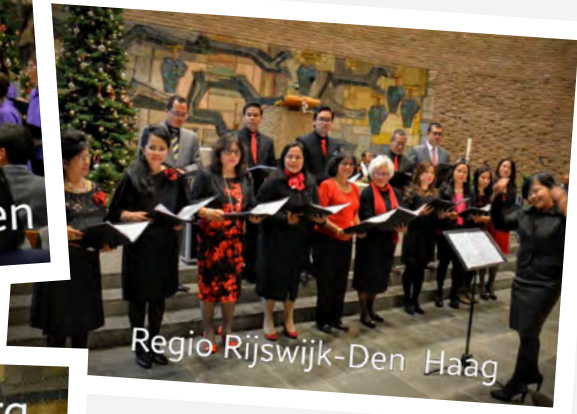
Regio Rijswijk-Den Haag